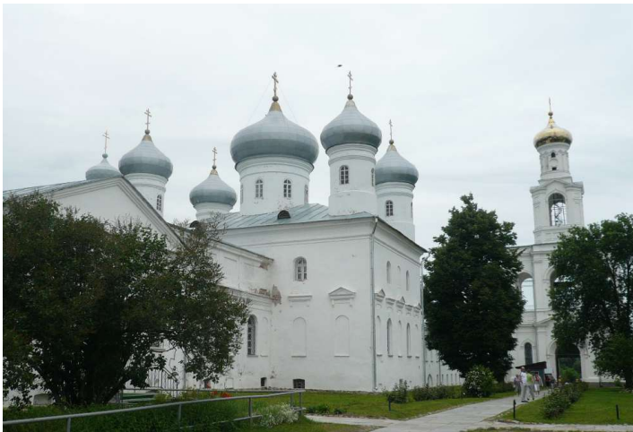
Спасский собор Свято-Юрьева монастыря, г. Великий Новгород

Псково - Печерский монастырь со дня основания именовали «Домом Пресвятой Богородицы». Это один из красивейших и древнейших монастырей. Здесь жили и творили молитвы 6 святых. Основан в 1473 году. Находится в 52 км от Пскова. С самого своего основания монастырь ни на день не прекращал своей деятельности. Еще в 14 веке здесь подвизались пустынники - монахи из Киево - Печерской лавры в природных пещерах. Здесь как в зеркале отразилась история государства Российского, бывали цари и главы нашего государства, многие тысячи паломников шли и ехали за Божией благодатью, а крепостные стены защищали от врага, здесь и сейчас совершают свой невидимый подвиг иноки, призывая к заступничеству Пресвятую Богородицу. Действуют храмы Сретенский, Успенский. На реставрации Михайловский. В пещерах покоятся мощи святых, монахов, родственников Пушкина, Кутузова - это некрополь монастыря. На святой горе растет древний дуб. Здесь воскресает глубинная