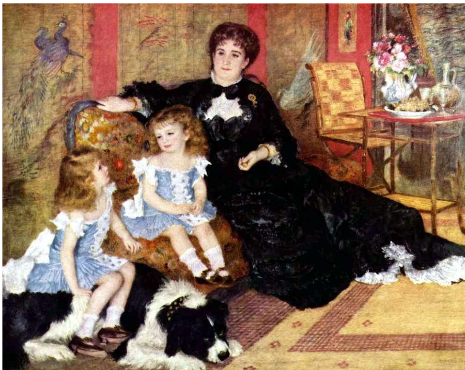
Ренуар Пьер-Огюст. Мадам Шарпантье с детьми

Составлено на основе советов Поля Брэгга, пропагандиста здорового образа жизни.