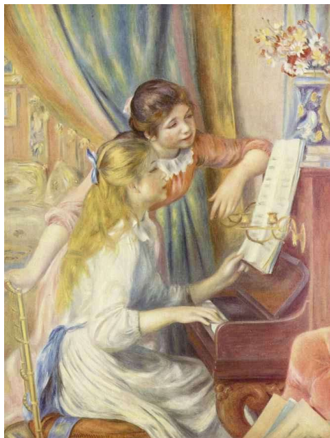
Ренуар Пьер-Огюст. За пианино

Этот мир так привлекает. Он доступен людям, которые осознали, что нужно жить активно, занимаясь