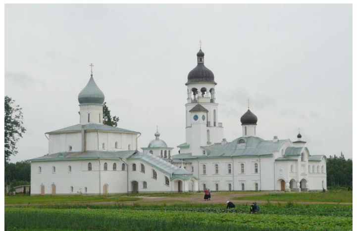
Иоанно-Богословский Савво-Крыпецкий монастырь. Псковская область

Главная святыня Пскова, его сердце, душа и символ - Свято-Троицкий Кафедральный собор. Этот город связан с именем первой Равноапостольной святой княгиней Ольгой. Её родина - местечко Выбуты. Здесь река шумит,