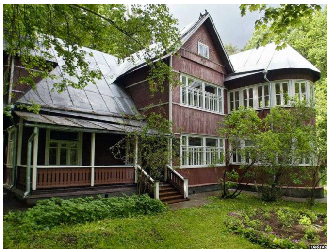
Дом-музей в Перedelкинo

Желаю Вам познакомиться и принять этот дар радости!