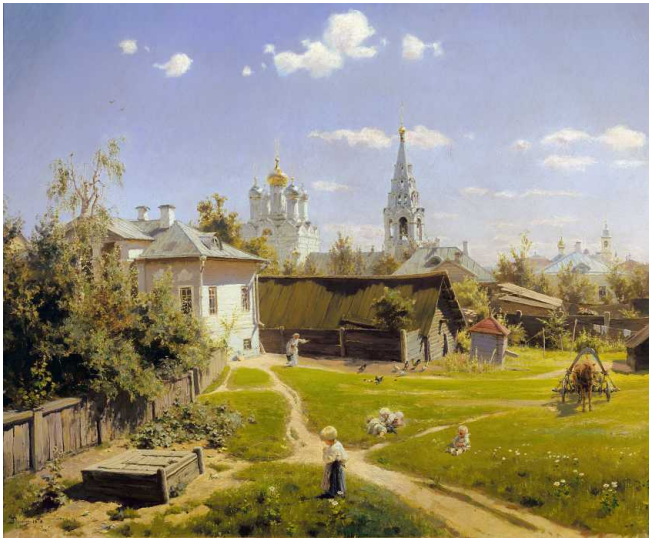
Московский дворик. 1878 Холст, масло. 64*80 см Государственная Третьяковская галерея, Москва

Впервые репродукцию этой картины я увидела в календаре в 13 лет. И с первого взгляда она произвела ошеломляющее впечатление. Столько света и воздуха было в ней, столько радости бытия. Захотелось узнать о художнике, об этой картине. Прошли