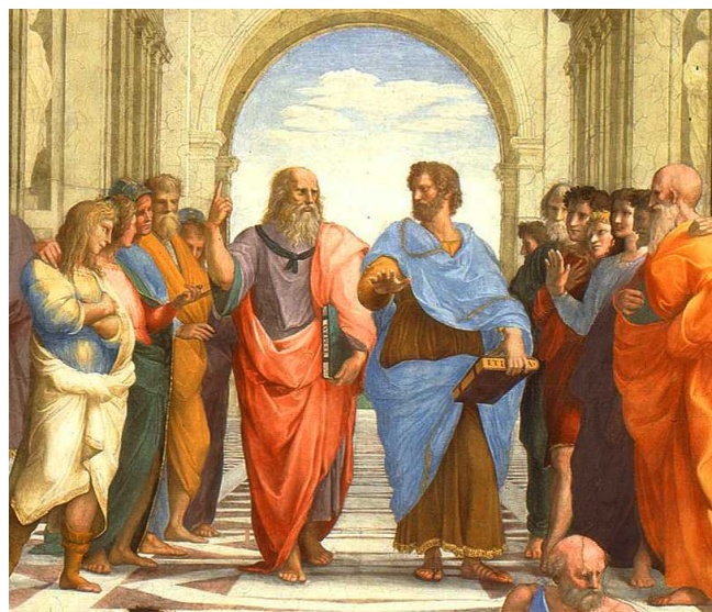
Платон (слева) и Аристотель (справа) Рафаэль. Афинская школа. 1510-1511 Фрагмент фрески, основание 770 см Рим, Ватикан, Станца делла Сеньятура

Таким образом Платон смог вернуться в Афины в 387 г. до н. э., и тогда-то, в возрасте сорока лет, он