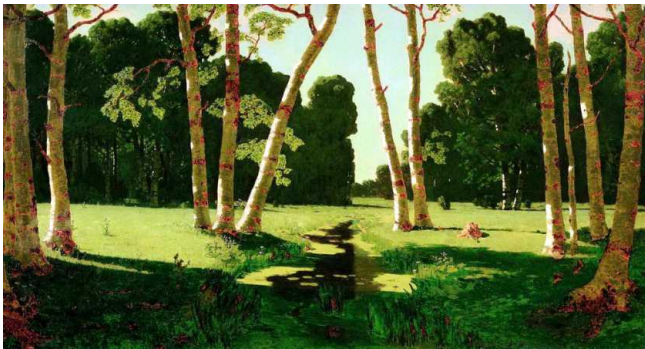
А.И.Куинджи Берёзовая роща. 1879 г.

Жизненный путь А. И. Куинджи был нелёгок: оставшись сиротой, мариупольский мальчик-пастушок, любящий рисовать, становится ретушёром у фотографа. Не раз ему пришлось менять место жительства, род занятий, но неизменным оставалось стремление рисовать. Это привело Архипа в Петербургскую Академию Художеств (АХ), но поступить в которую сразу он не смог из-за слабой подготовки и оказался среди учащейся искусства молодежи, ютившейся на чердаках АХ. Грамотой он почти не владел, не признавал традиций, святыни художественного культа считал устаревшими. Академические рисовальные вечера и научные лекции Куинджи не посещал, до всего