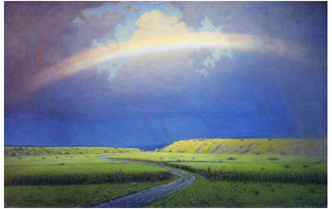
А.И.Куинджи Радуга. 1900-1905 г. Холст, масло. 171*110 см Русский музей, г. Санкт-Петербург

Государственная Третьяковская галерея, г. Москва