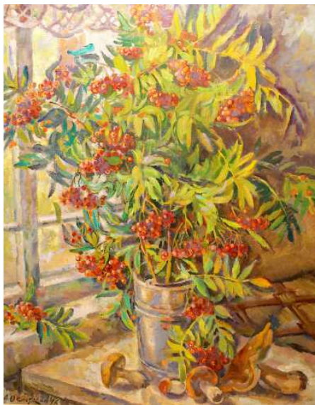
Осмёркин А.А. Натюрморт с рябиной. 1946

На протяжении всей жизни Осмёркин был окружен замечательными людьми. Он дружил с А.Ахматовой, С.Есениным, Л.Гумилёвым, Л.Утёсовым,