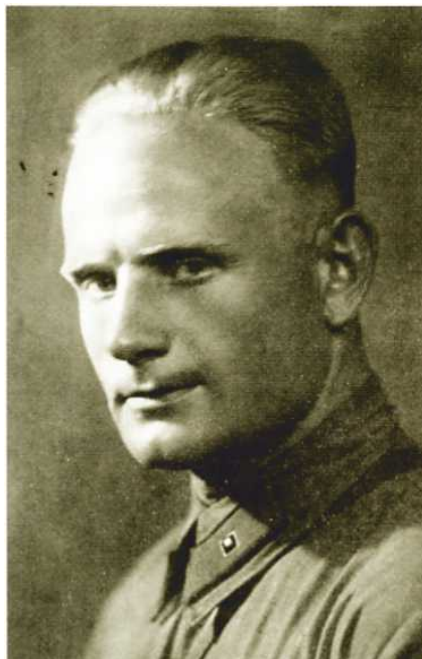
В армии. 1941 г. (фото)