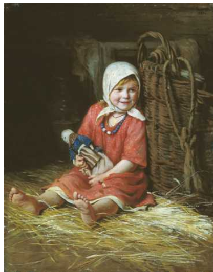
Варька. 1893 г.

скую. Жители Ховрино изображены на многих картинах Лемоха. В начале 1870-х обратился к технике офорта, которую осваивал под руководством И.И.Шишкина. Был первым среди русских художников, кто выполнял миниатюрные портреты с фигурами в рост. В 1880 -1890-х являлся постоянным участником собраний ученых и художников у Дмитрия Ивановича Менделеева. Карл Викентьевич принял приглашение давать частные уроки рисования детям будущего императора Александра III, в том числе и Цесаревичу Великому князю