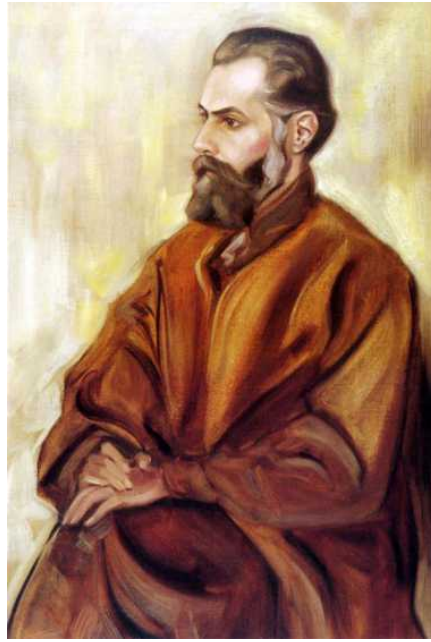
Святослав Рерих Автопортрет. 1940-е Государственный Музей Востока, музей Н.К.Рериха

возвышенное пробуждается в душе при виде этих гор, великом центре духовного паломничества.