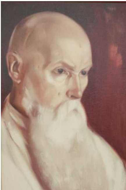
Святослав Рерих Профессор Николай Рерих 1944

Широко представлены 322 полотна - этюды знаменитой серии «Гималаи» Николая Константиновича, написанные в основном в 1929-1946 годах. Работы выполнены на картоне темперой. «Гималаи» - это предстояние перед обителью Богов. Внешний облик и внутренняя суть гор сливаются воедино. Нечто