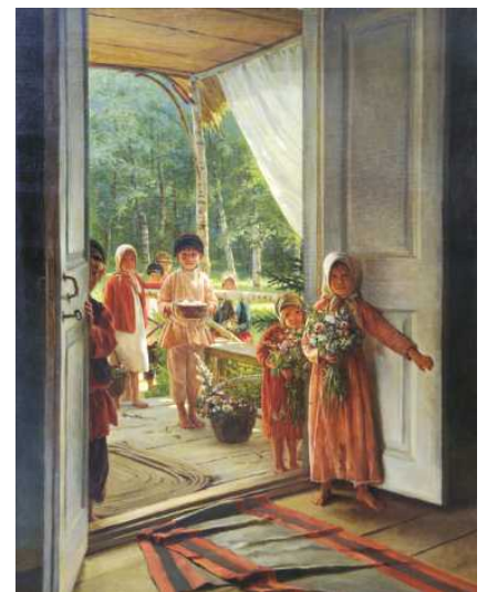
Лето. С поздравлениями. 1890