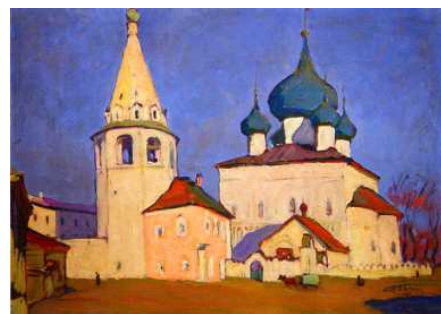
Суздаль. 1959 г.