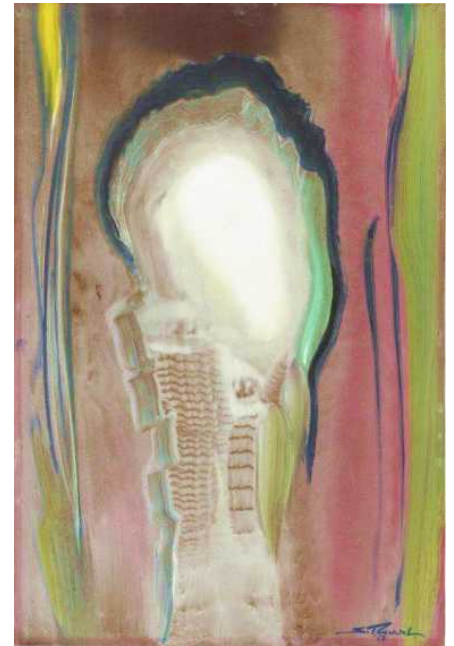
Святослав Рерих Свет через сухое дерево. 1968 Государственный Музей Востока

Большую ценность составляют документы из архива семьи. Здесь письмо Николая Константиновича 1920-х годов, адресованное Тибетскому правителю Далай-ламе XIII. Значительная часть материалов относится к научно-художественной экспедиции в Центральную Азию. Это дневники Елены Ивановны, фотографии и другое.