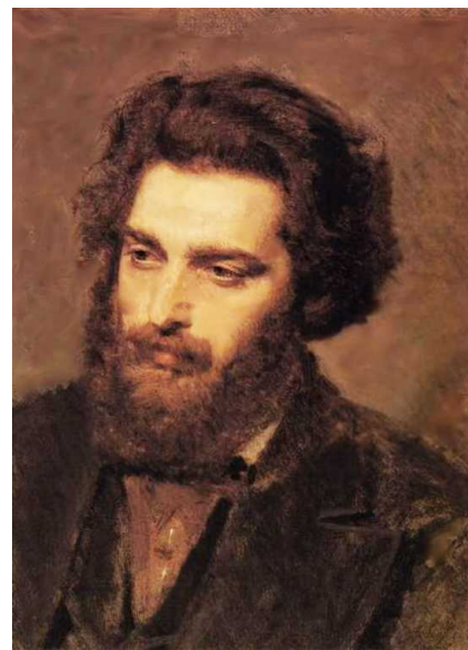
И.Н.Крамской. Портрет художника Архипа Ивановича Куинджи 1877