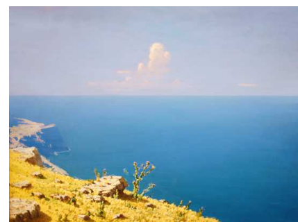
Море. Крым. 1908

а точнее ощущение света; картина словно наполнена воздухом, солнцем, лесным ароматом, свежестью. Смелость обращения художника с цветом и краской, которая казалась современникам дерзкой и необъяснимой, находит своё продолжение в творчестве его учеников, в том числе Н.К. Рериха, А. Рылова, К. Богаевского, Н. Крымова. Куинджи открыл большие перспективы и для искусства будущего — символизма, экспрессионизма, примитивизма, фовизма. Во всех разделах