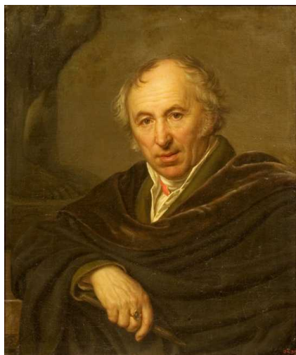
А.Г.Варнек. Портрет И.П.Мартоса. 1819

Родился Иван Петрович в городке Ичня Полтавской губернии в семье мелкопоместного дворянина. Окончил курс в 1773 году с малой золотой медалью и был отправлен в Италию в качестве пенсионера Академии. В Риме учился в мастерской Баттони и под руководством Рафаэля Менгса. После возвращения в Санкт-Петербург в 1779 году становится преподавателем ваяния в Академии. В 1782 получает звание академика за скульптуру «Геркулес, отдыхающий от трудов». В 1794 становится старшим профессором, в 1814 — ректором, а в 1831 — заслу-